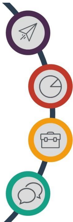
TABLE OF CONTENTS